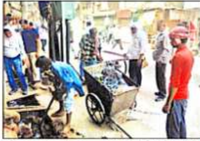
जोनल वार्ड स्वच्छता अभियान